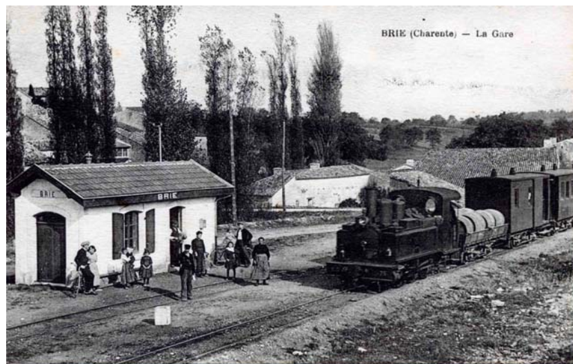
En 1912, le premier train à vapeur de la ligne Angoulême - Confolens s'arrête à Brie.